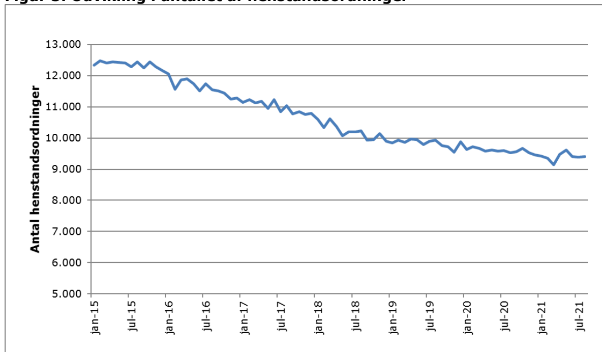
Figur 3. Udvikling i antallet af henstandsordninger