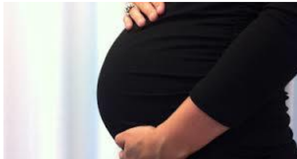
Graviditetsbesøg til alle

Vi ved at der er overvældende dokumentation for, at tidlig indsats overfor sårbare familier, kan være med til at mindske social ulighed i sundhed.