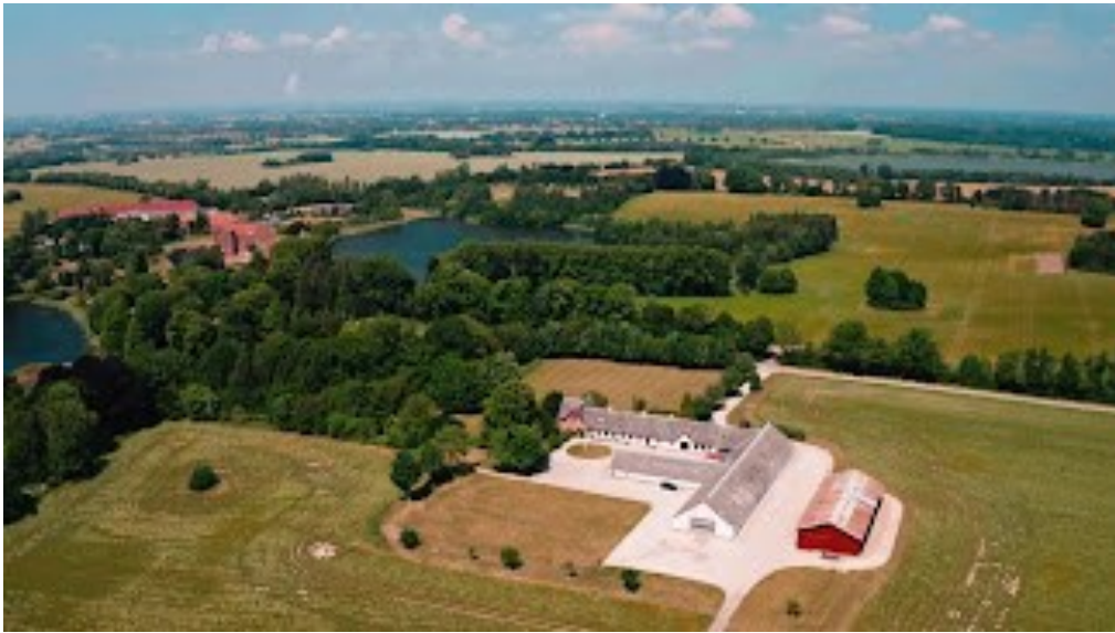
Edelsminde Bed & Breakfast